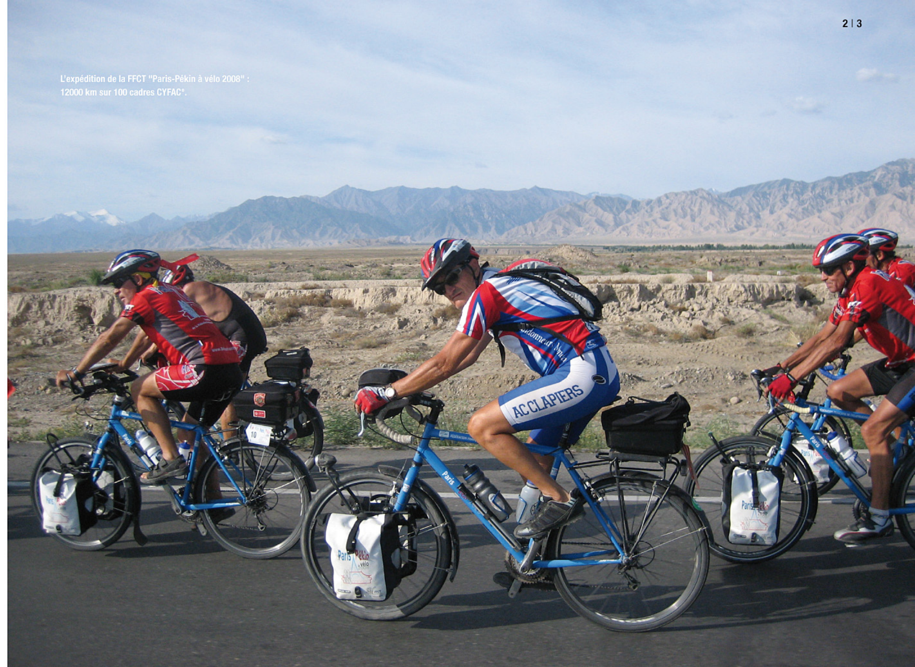
L'expédition de la FFCT "Paris-Pékin à vélo 2008" : 12000 km sur 100 cadres CYFAC®.

Photos non contractuelles. CYFAC® International se réserve le droit de modifier à tout moment et sans préavis les caractéristiques techniques et esthétiques des produits présentés dans ce document. Ce catalogue est édité par CYFAC® International - La Fuye - 37340 Hommes. Tél : 02 47 24 67 42 - Fax : 02 47 24 96 24 - SARL au capital de 10 000€ - 509 116 034 00018 RCS TOURS. Conformément à la loi "Informatique et liberté" du 06/01/1978, vous possédez un droit de rectification ou de suppression concernant vos coordonnées nominatives en écrivant à CYFAC® International - La Fuye - 37340 Hommes. Ne pas jeter sur la voie publique.