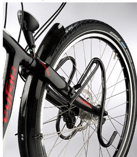
Fabrication et montage dans nos ateliers à La Fuye (Indre et Loire - 37).